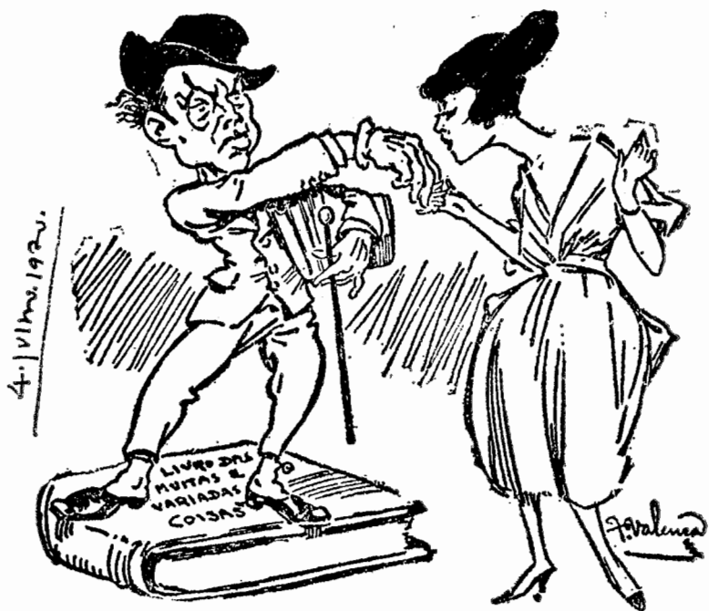
Sátira caricatural alusiva ao «Livro das muitas e variadas coisas»