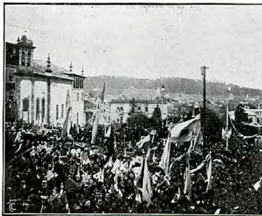
Multidão aclamando El-Rei em frente ao palacete do Conde de Margaride onde Sua Magestade se hospedou

Visita de El-Rei D. Manuel II (1889-1932) à Casa do Carmo em Guimarães dos Condes de Margaride em 29-11-1908