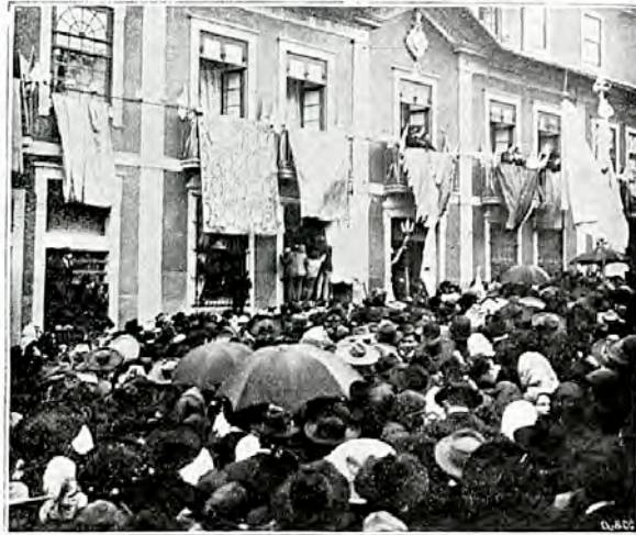
El-Rei D. Manuel na varanda do palacete do Conde de Margaride agradecendo as calorosas manifestações do povo

Visita de El-Rei D. Manuel II (1889-1932) à Casa do Carmo em Guimarães dos Condes de Margaride em 29-11-1908