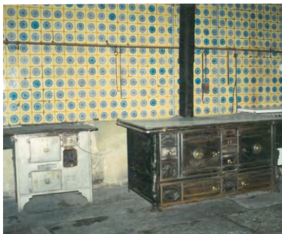
Interior da Casa do Carmo dos Condes de Margaride em Guimarães