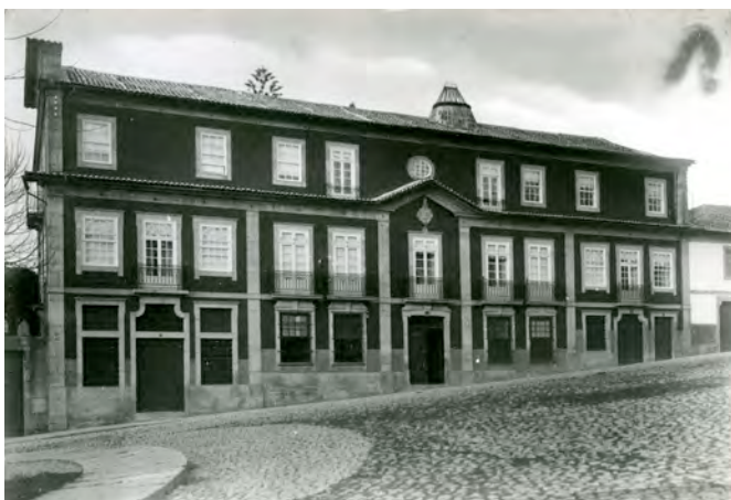
Casa do Carmo dos Condes de Margaride em Guimarães

S.M. vestia de almirante, trazendo ao seu lado seu augusto irmão, e os snrs. Fontes e Avelino.