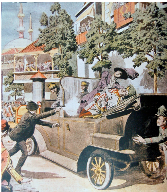
1. O atentado de Sarajevo (reconstituição)

A 28 de Junho de 1914, o Arquiduque Francisco Fernando, herdeiro do trono austro-húngaro, na sua qualidade de inspector-geral do exército, visita Sarajevo, capital da província da Bósnia, onde tinha ido assistir a manobras militares. Acompanha-o sua mulher. Chegado de comboio, dirige-se à Câmara Municipal em automóvel descapotável. No trajecto, é lançada uma bomba sobre o seu carro, mas que explode junto de outro veículo da comitiva, ferindo um oficial. Finda a cerimónia, dirige-se ao hospital para visitar o ferido; o motorista engana-se no caminho e pára, a fim de mudar de direcção, em frente de um café onde se encontrava Gavrilo Príncipe, um bósnio de 19 anos, que mata o casal a tiro de revólver.