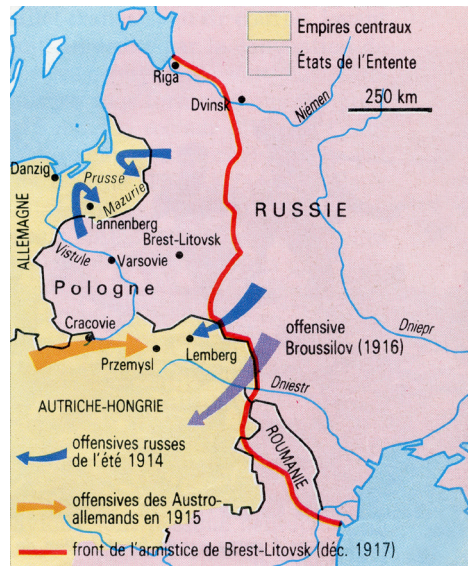
6. A frente oriental

morreram 80 000 soldados britânicos; 2) que a invasão depara com a resistência civil, de franco-atiradores, de sabotadores de pontes e de linhas de comunicação; 3) que nos combates foram utilizadas novas armas: melhores metralhadoras, morteiros (tiro curvo), artilharia pesada; zeppelin e aviões lançam bombas sobre povoações.