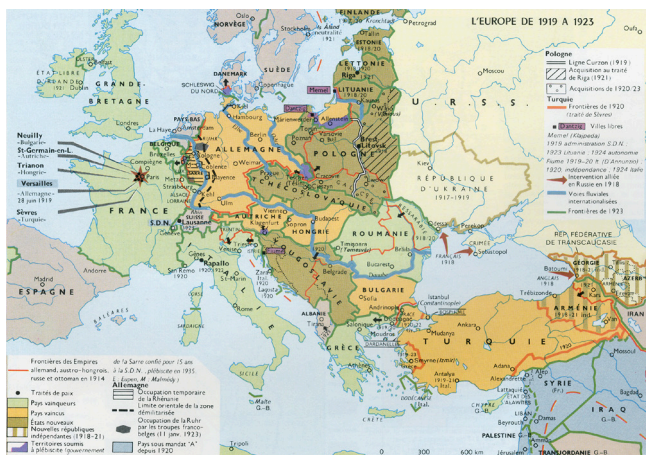
7. A Europa, de 1919 a 1923

Portugal recebeu algumas reparações, entre as quais a propriedade dos navios mercantes alemães que tinham sido apresados quando da entrada na Guerra. Mas mais importante foi ter-se obstado às pretensões da Bélgica sobre Cabinda e o Baixo Congo até Ambriz, às ambições da China sobre Macau; da África do Sul em relação a Lourenço Marques, da Holanda sobre Timor; da França sobre as possessões da Índia, da Itália, na instalação de colonos italianos no planalto de Benguela e no sul da Angola. Foi confirmada a posse de Quionga por Portugal e o direito a receber “reparações de guerra” da Alemanha, pelos danos causados em Angola e Moçambique 47 .