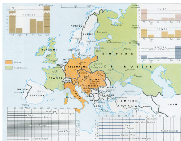
4. As alianças europeias em 1914

A Trípla Aliança. As tensões entre os Estados levaram à formação de alianças múltiplas. A Alemanha, se recordarmos a imagem de Bismarck, sentia-se “cercada” pela França e pela Rússia, o que a obrigaria, em caso de conflito, a combater em duas frentes. Procurou, por isso, isolar a França, constituindo, em 1873, uma coligação com a Áustria e a Rússia (Liga dos Três Imperadores), que se desfez quando no Congresso de Berlim foi retirado à Rússia o que adquirira ao vencer a Turquia. A Alemanha fortaleceu então a aliança com a entrada Itália (1882), que se sentia prejudicada com a anexação da Tunísia pela França (1881) e com o apoio por ela prestado à Santa Sé, o que impedia a unificação italiana. Nesta aliança havia um ponto fraco, a Itália: os nacionalistas italianos desejavam readquirir Trentino e Trieste e zonas da Dalmácia, sob domínio austríaco; a Itália assinou um acordo com a França (1900), declarando manter a neutralidade em caso de ataque por uma terceira potência, em troca de liberdade de acção em Tripoli, e declarou à Rússia “encarar com benevolência” as suas pretensões sobre os Estreitos (Bósforo e Dardanelos) e Constantinopla, o que era contrário à política alemã.