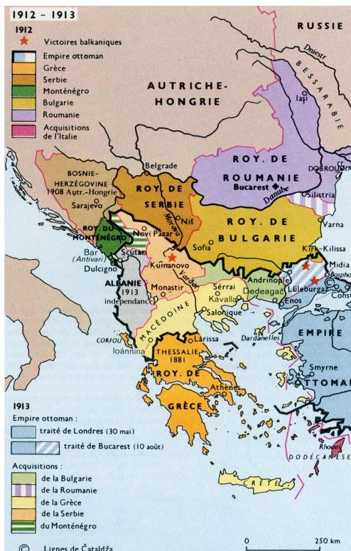
2. Mapa dos Balcãs, 1912-1913

plano de transformar a Monarquia Dual 1 (Áustria e Hungria) numa Monarquia Tríplice, com a criação, na metade húngara, de uma nova unidade autónoma, de população eslava (sérvio-croata); o próprio Imperador temia a sua actividade futura, como se depreende da sua exclamação ao receber a notícia da morte de Francisco Fernando: “para mim é um grande alívio de preocupações” 2 . O plano do Arquiduque (trialismo) desagradava também à Sérvia, que temia o efeito desse projecto junto de outros grupos eslavos, o que contrariava a sua ambição de, com eles, vir a formar a Grande Sérvia.