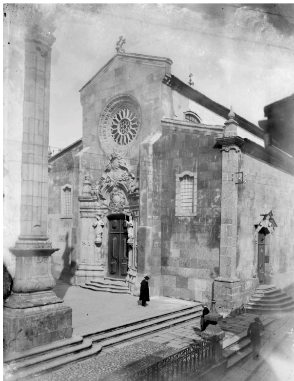
Fig.2 - Igreja do Convento de São Domingos, 1ª metade séc. XX

A descrição da obra no registo notarial estende-se em apontamentos apresentando vários dados de natureza técnica e estética. Os mestres obrigavam-se a executar uma escada de pedra fina de seis palmos e meio de largo, com o respetivo corrimão e “moldura corrida nelle e quartella no principio” . No fim desta escada que se “despede na varanda” do claustro, seria construído um portal de pedra fina de capitéis, pilares e arcos lisos. Do programa construtivo constava ainda a abertura de um portal de pilares, capitéis e “baras” dóricas. Encostado à parede do claustro, os mestres comprometiam-se a fazer um lavatório “semelhante ao risco dos tumbullos” com a respectiva pia e carrancas. A sacristia levaria uma pequena pia para a água benta.