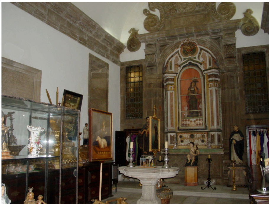
Fig. 5— Igreja de São Domingos: Capela tumular e sacristia