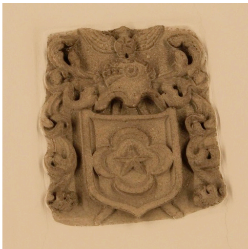
Fig. 3 – Pedra de armas do testador: tecto da Capela tumular e sacristia