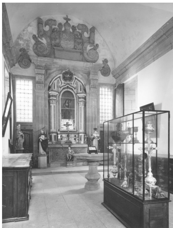
Fig. 4 – Igreja de São Domingos: Capela tumular e sacristia (foto DCEMN)