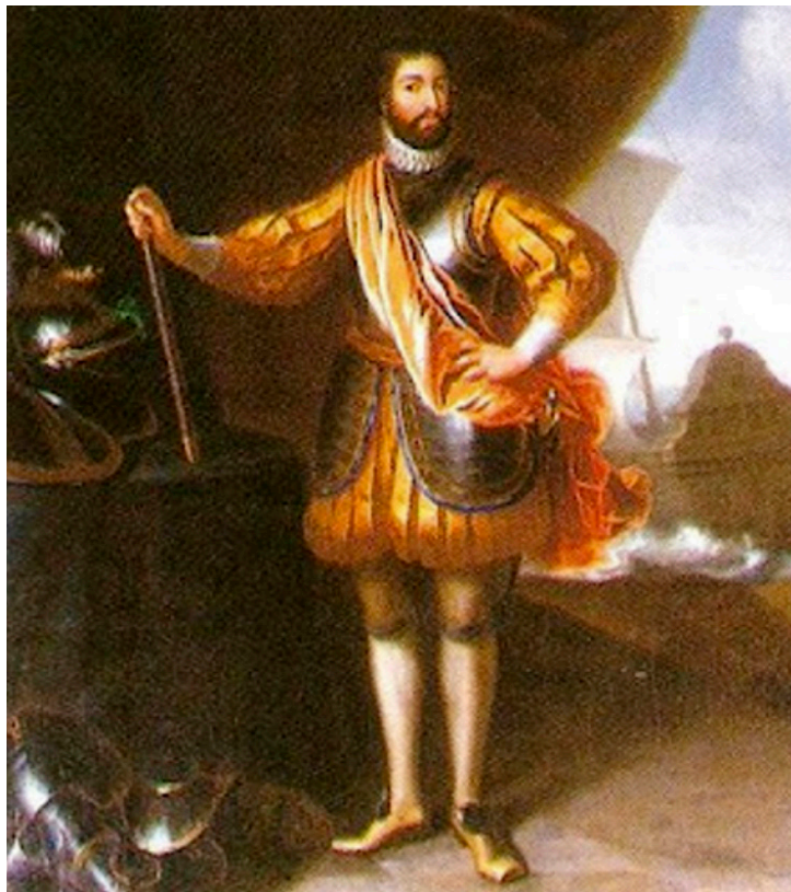
D. Teodósio I, 5º Duque de Bragança

* em Vila Viçosa, Évora cerca de 1510, † aí em 22-9-1563