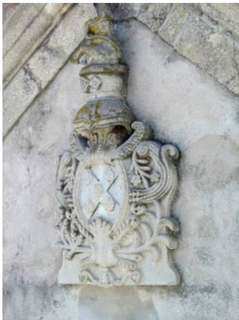
Brasão da Capela da Casa do Portuzelo