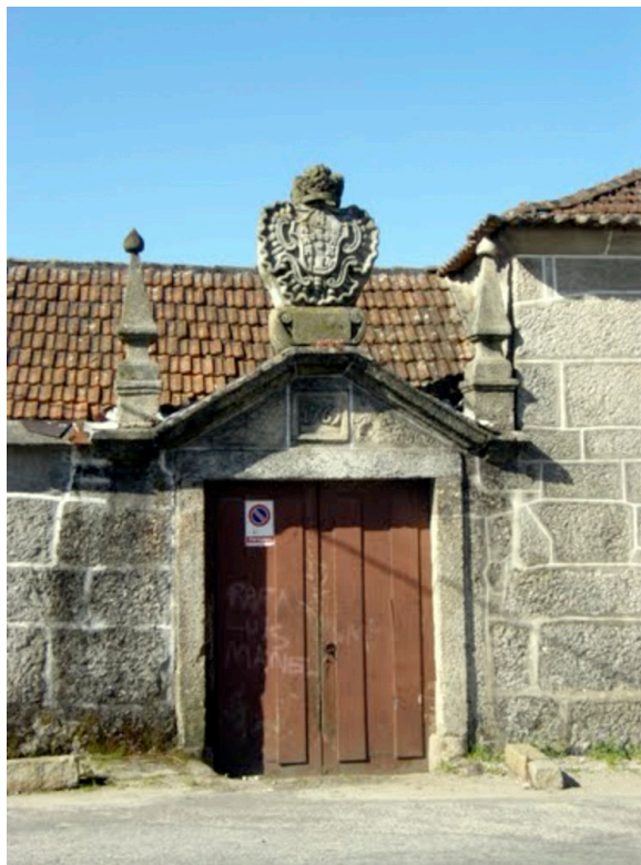
Casa do Areal em Baltar, Paredes

II - AFONSO FAYÃO , filho natural de D. Teodósio I, 5º Duque de Bragança e duma dama solteira do Paço Ducal de Vila Viçosa, foi apresentado pela Casa de Bragança aos 13 anos; viveu naquela que é chamada a Casa do Areal (ou da Estalagem), em Baltar, Paredes, Porto; o seu nome aparece pela primeira vez, no registo paroquial da freguesia de Baltar a 20-1-1594, como padrinho num assento de baptismo, intitulado-se Abade de Baltar; a sua assinatura aparece nos registos desde 11-5-1603 a 16-8-1622. 3