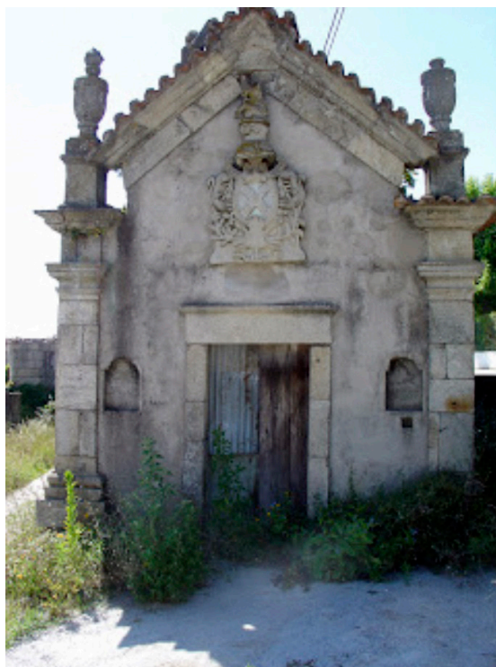
Capela da Casa do Portuzelo